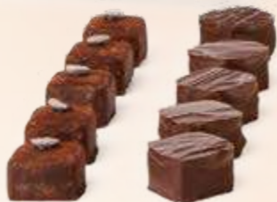
LÁGRIMA DE LA INDIA