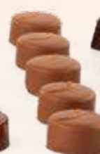
PRALINÉ DE AVELLANA