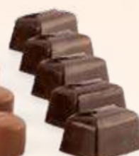
CARAMELO FLOR DE SAL