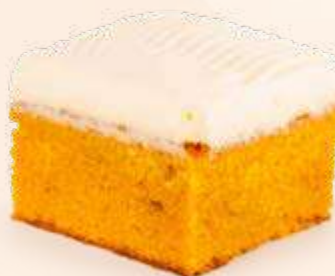
carrot sin gluten

Esponjoso bizcocho sin gluten, de zanahoria con canela, cubierto de frosting de queso.