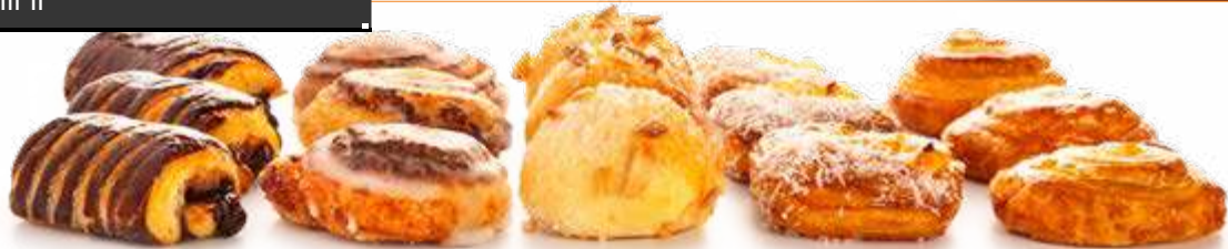
Napolitana de chocolate